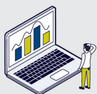
CTIfeed [app web]