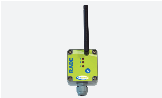
Radio antena para comunicaciones