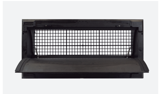
Entrada de aire de poliuretano